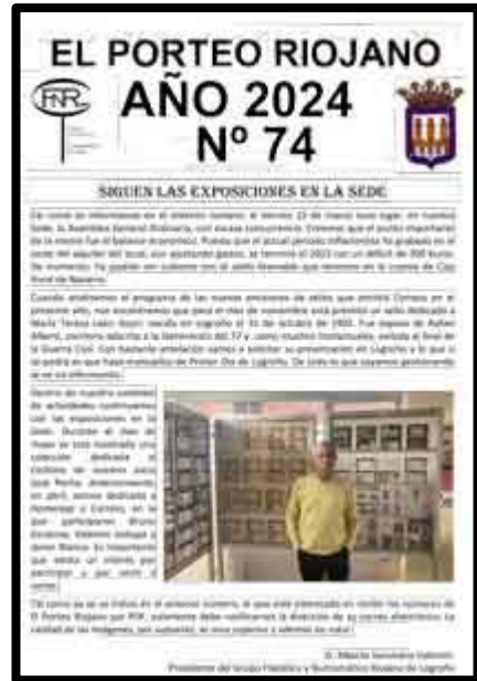
Nº 74 matasellado Logroño Turístico nuevo