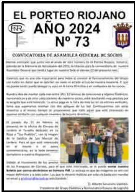
Nº 73 mayo mandado desde Lardero

Son diecinueve años los que llevamos publicando nuestro Boletín con el fin de mantener informados a todos nuestros socios de todo lo que acontece en nuestro Grupo así como artículos sobre temas filatélicos y numismáticos