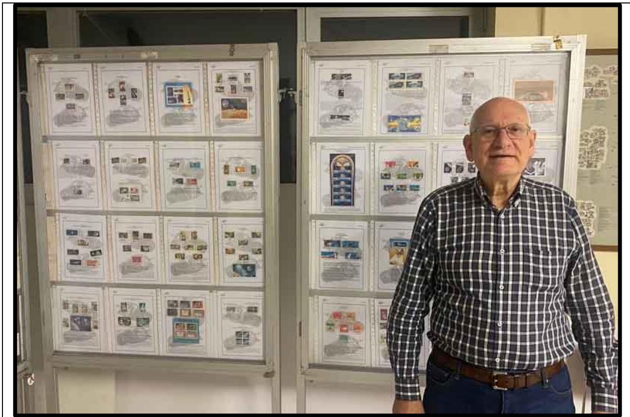
Sellos de todo el mundo con la temática del Cohete