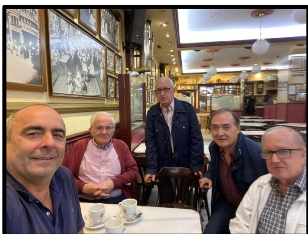
Café Moderno tertulia del coleccionismo

En nuestra sede mantenemos una exposición permanente con todos los sobres realizados por el grupo en los más de 60 años de historia y una colección de fotografías de nuestras diferentes actividades a lo largo de los años.