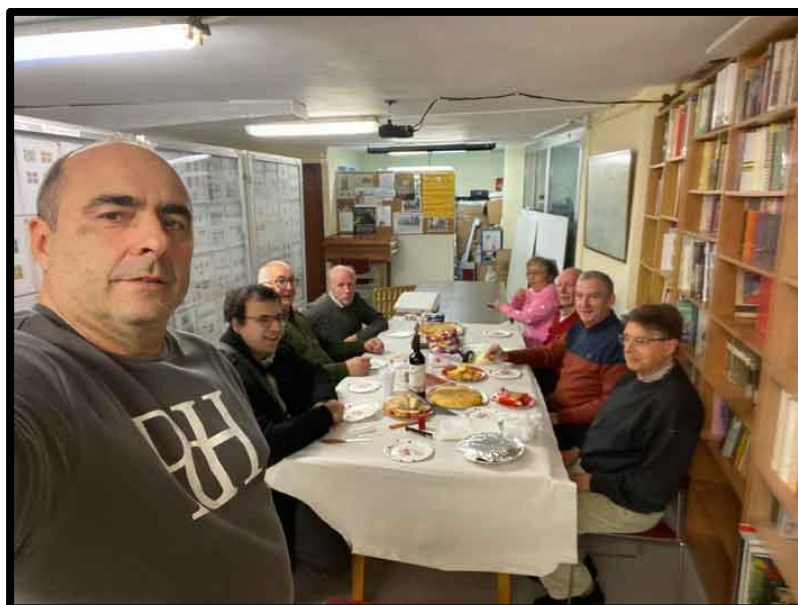
Cerramos el año con un vino de Rioja