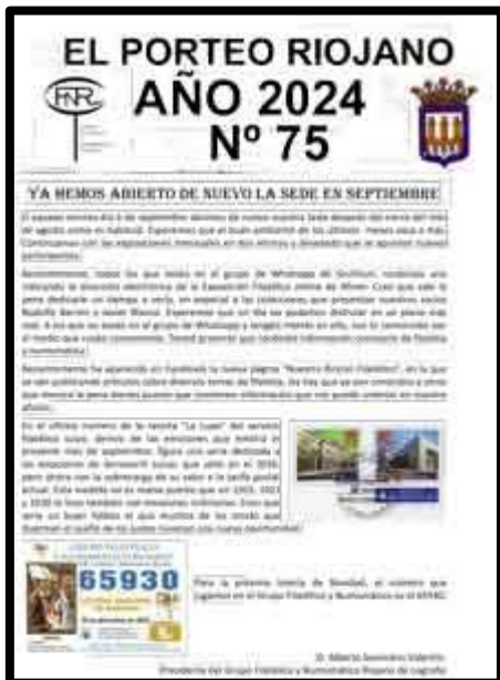
Nº 75 septiembre mandado desde Oyón