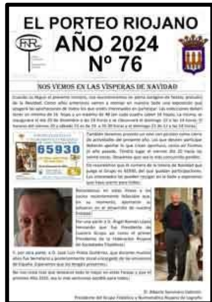
Nº 76 diciembre mandado desde Calahorra

Continuamos un año más mandando el porteo desde diferentes localidades. Nuevo turístico del camino de Santiago en Logroño, Oyón, Calahorra